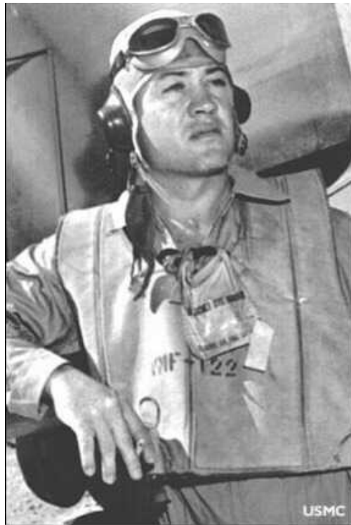
Gregory "Pappy" Boyington, C.O. VFM 214, The Black Sheep Squadron

Intervista di Colin Heaton per Aviation History Magazine(1988) Traduzione di EAF51_Bear