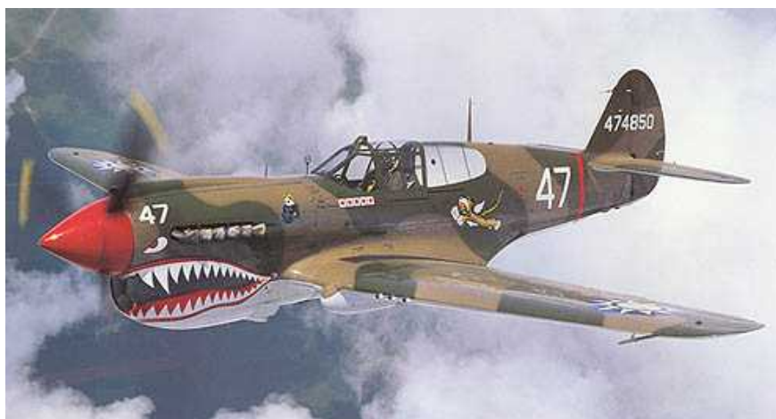
Un Curtiss P-40 con la colorazione dei Flying Tigers

AH: Come era organizzato l'AVG quando lei arrivò?