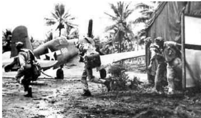
Le "pecore Nere" in decollo su Scramble

Boyington: Con tutti eccetto che con Lard. Lui sapeva dei problemi legati al bere in Cina ed a Burma. Io non dovevo bere. Se lo facevo dovevo essere denunciato. Lo facevo qualche volta, e Lard lo seppe e mi mise agli arresti. Se non volavo non potevo socializzare. Devo dirle se obbedii o no ai suoi ordini?