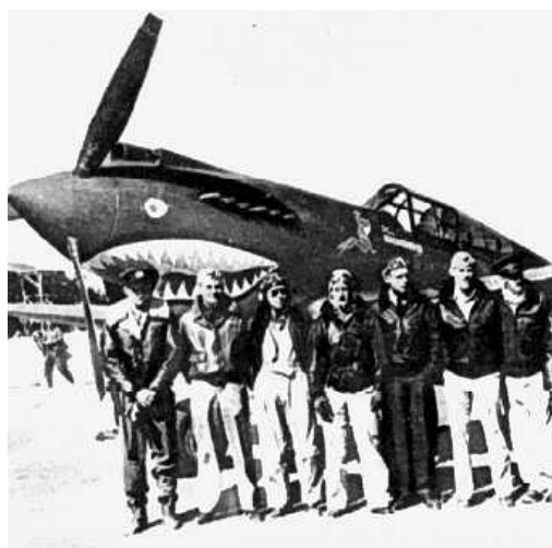
Flying Tigers a Burma

AH: Ci descriva il combattimento con il P-40 contro i Giapponesi. Come era a confronto con il Mitsubishi A6M Zero?