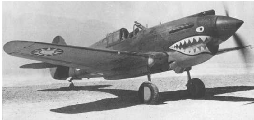
Un Curtiss P-40 dell'AVG in China

corazzature nel cockpit e serbatoi auto sigillanti. I japs non avevano nulla di tutto questo, e gli costò caro per tutta la durata della guerra.