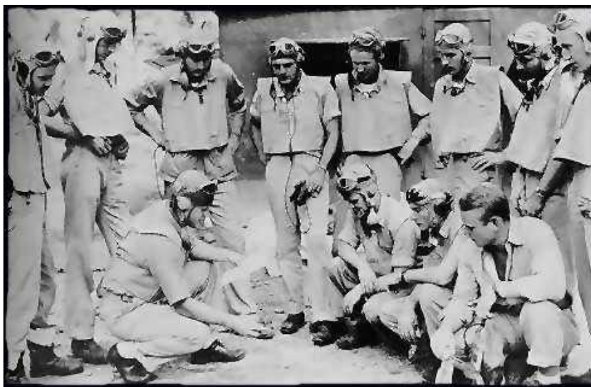
Le Black Sheep in un mission briefing

AH: Non fu ripescato da forze amiche, vero?