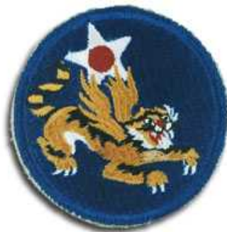
Il badge delle AVG Flying Tigers

AH: Quando incontrò la prima volta Claire Chennault, e cosa pensò di lui?